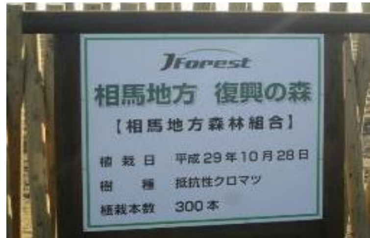
【植樹祭】協力業者PR看板設置