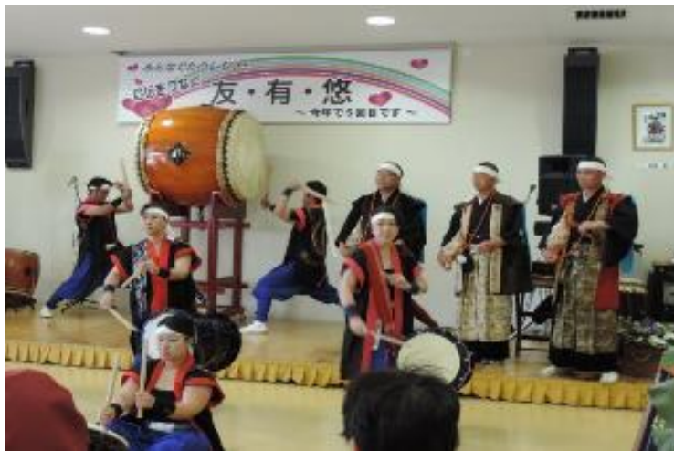
「相馬野馬追太鼓」 会場に響く