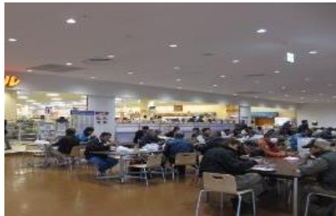
富岡町ショッピングセンター にぎわう フードフロアー

富岡町では、駅前整備、災害公営住宅、公共施設などの建設が進む。避難解除後の生活環境整備が優先されている。福島第一原発廃炉作業員の休憩・宿泊提供のため、施設建設もある