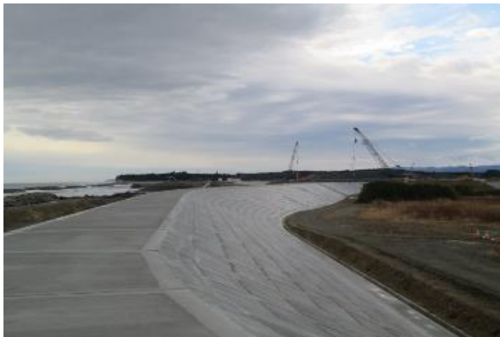
小高区塚原海岸防潮堤 未整備の箇所あり