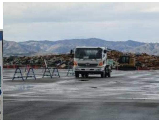
解除後 解体がれき搬入始まる