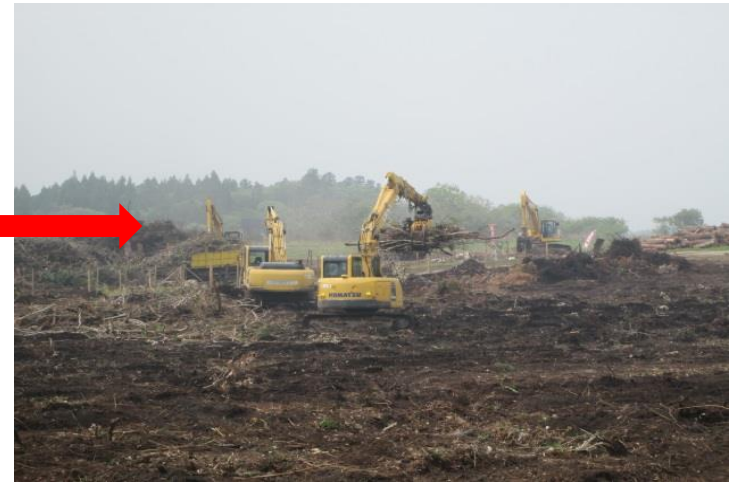
水素製造工場のために造成が進む