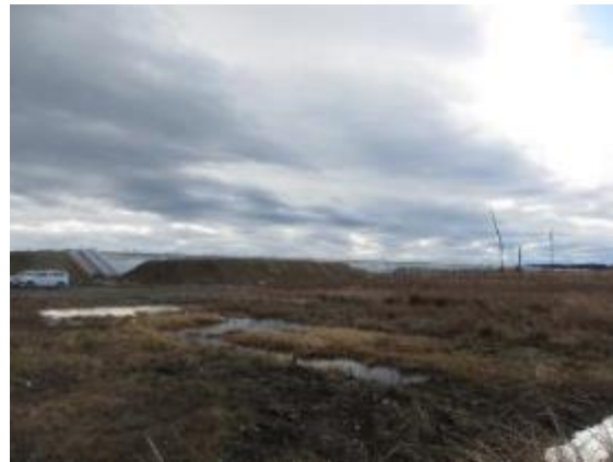
請戸沿岸防潮堤建設