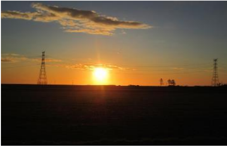
雫地区復旧田圃から初日の出を望む