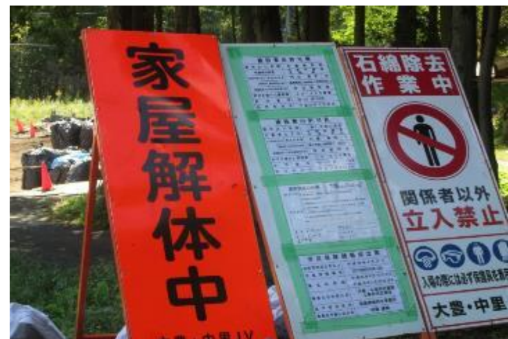
浪江町郊外 住宅解体作業工事中