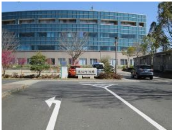
避難解除で浪江町役場再開 復興拠点