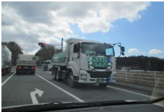
環境省 除染廃棄物運搬車両