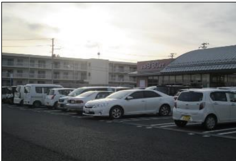
商業施設近くの災害公営住宅