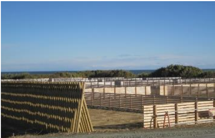
【植樹祭】準備が進む 木枠内はクロマツ植樹地