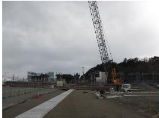
高架橋仮設工事現場