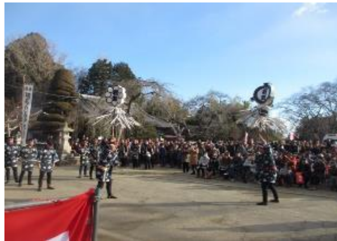
出初式 小高神社奉納