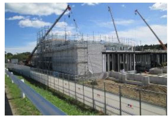
二次医療を担う県立ふたば医療センター