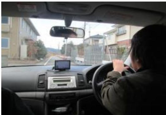
左側 解除 右側 帰還困難区域