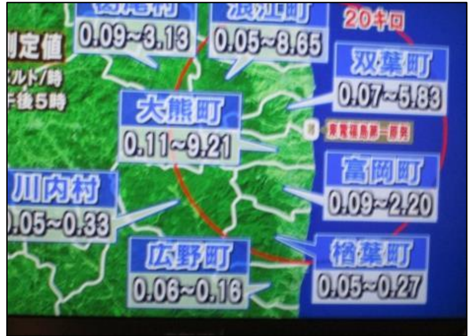
H30年1月18日 双葉郡町村放射線量数値

南相馬市は、3つの区域に分断され、ここから住民の苦難が始まった。復興、復旧はこういった状況が解消されてこそ、なしえる？のではないだろうか。