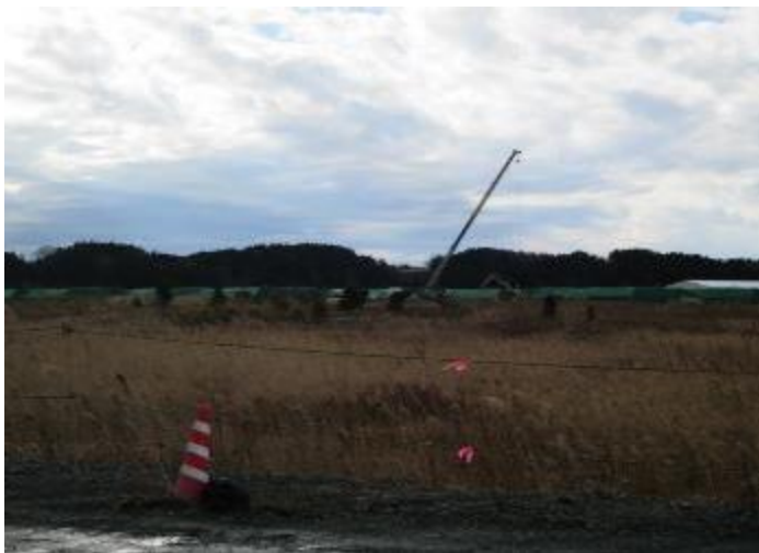
双葉町両竹地区 仮置き場 唯一避難解除された地区