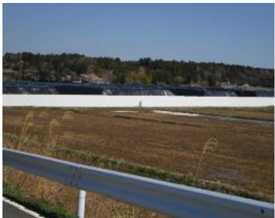
郊外には巨大な「除染仮置き場」