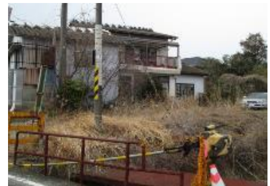
すべての家が荒廃