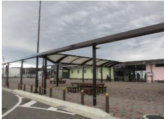
富岡町駅 下りは未整備