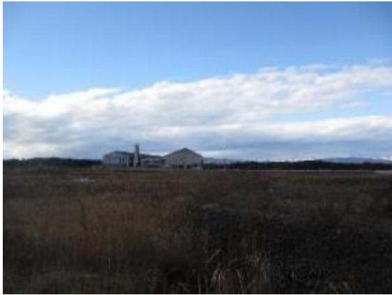
災害跡地の整備と請戸小学校