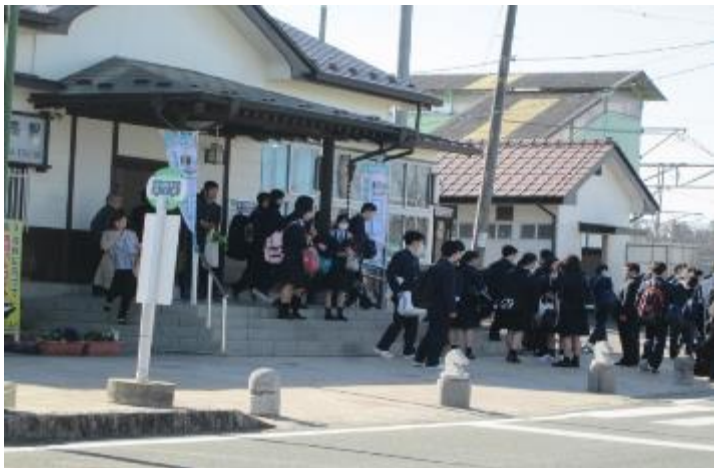
県立小高産業技術高等学校開校 朝夕の駅の賑わい