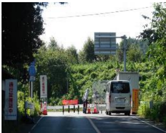
除染廃棄物搬入現場

帰還率 2% 役場周辺 国道6号線沿いは 復旧・復興関係者の出入りで 活気がある。 街中はまだ手つかず。 昨年11月「十日市」再開。 多くの住民でにぎわう。