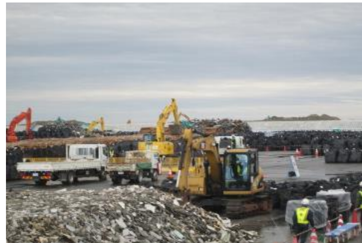
村上地区 20km圏内 廃棄物分別処理場