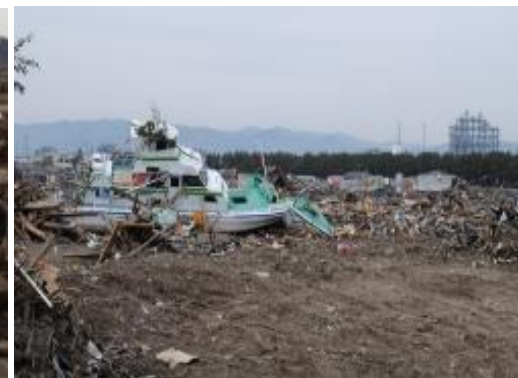
国道6号線に乗り上げた漁船