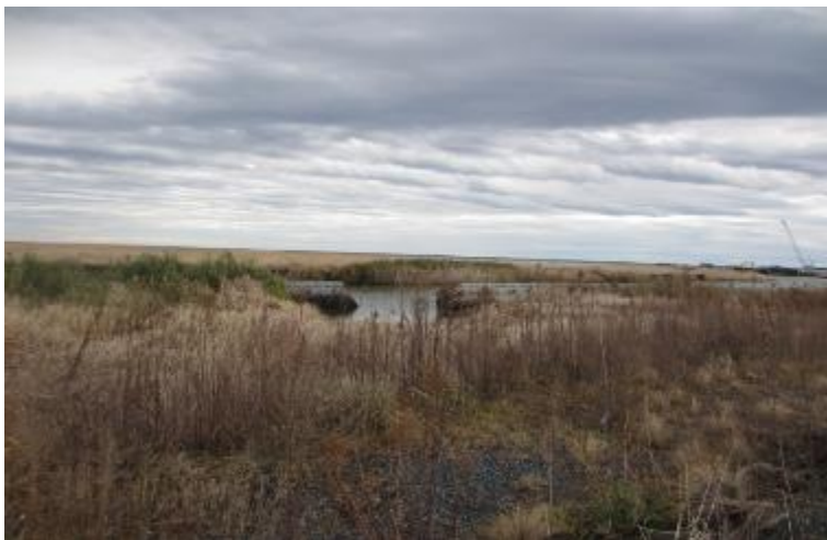
両竹地区前田川損壊 復旧手つかず