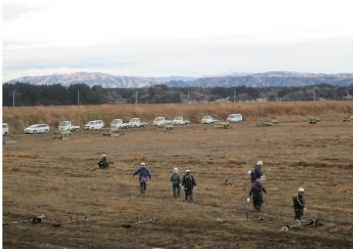
小高区塚原 陥没した農地の整備作業