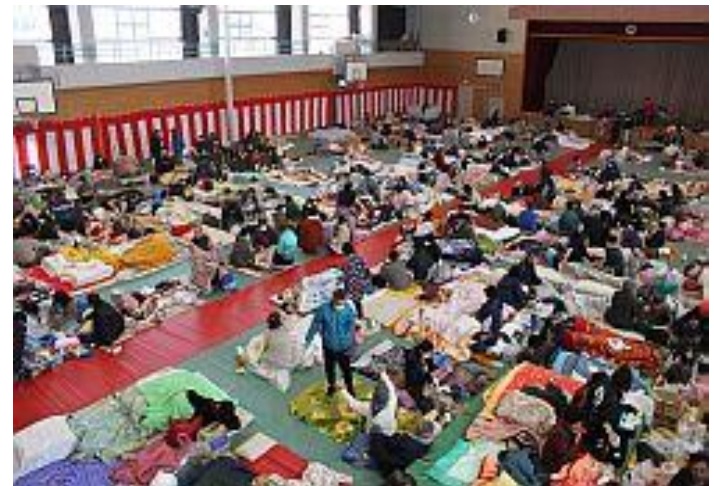
南相馬市立石神第2小学校 避難所