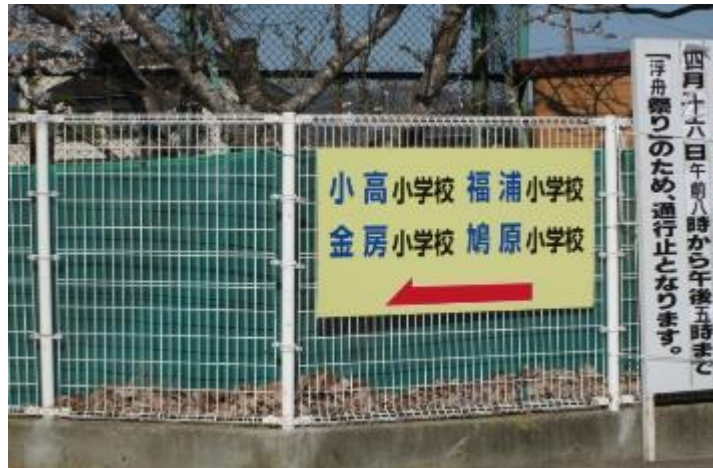
小高小学校校舎に 4校が入る