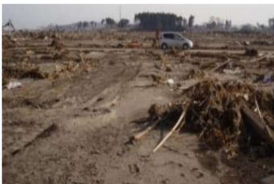
原町区南萱浜集落 津波で壊滅