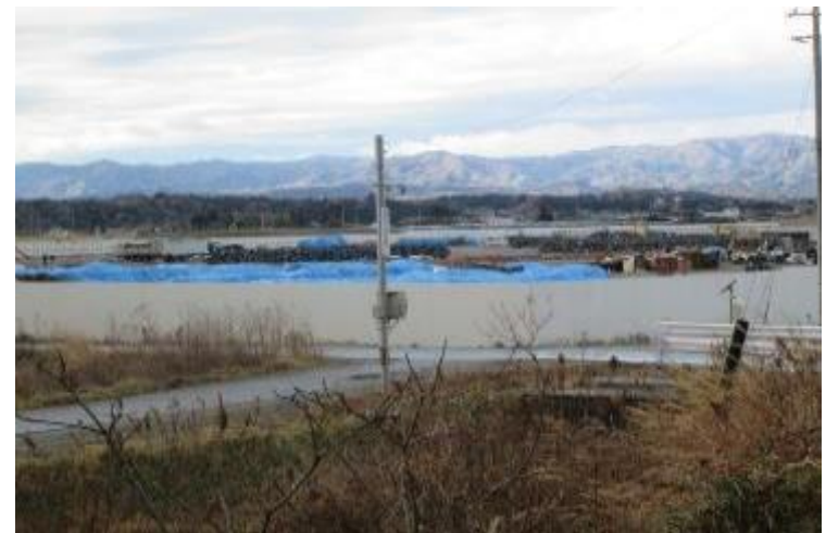
棚塩地区「除染廃棄物仮置き場」拡大