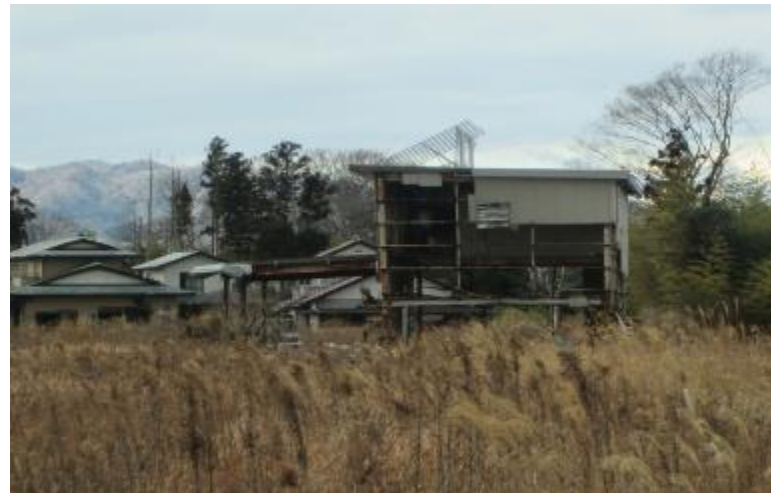
両竹地区集落 津波はこの家で止まった