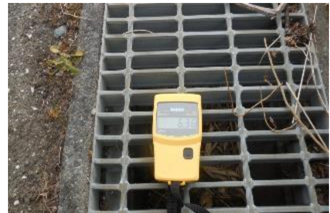
双葉町 駅前通り側溝上 6.36 \mu Sv/h