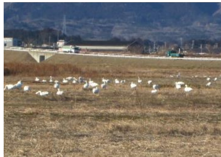
昨年11月半ば白鳥飛来