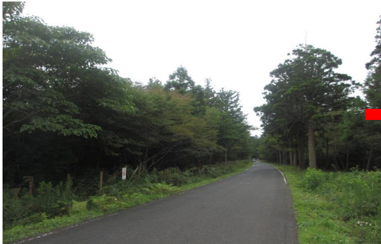
唯一 津波を免れた豊かな植生の海岸林