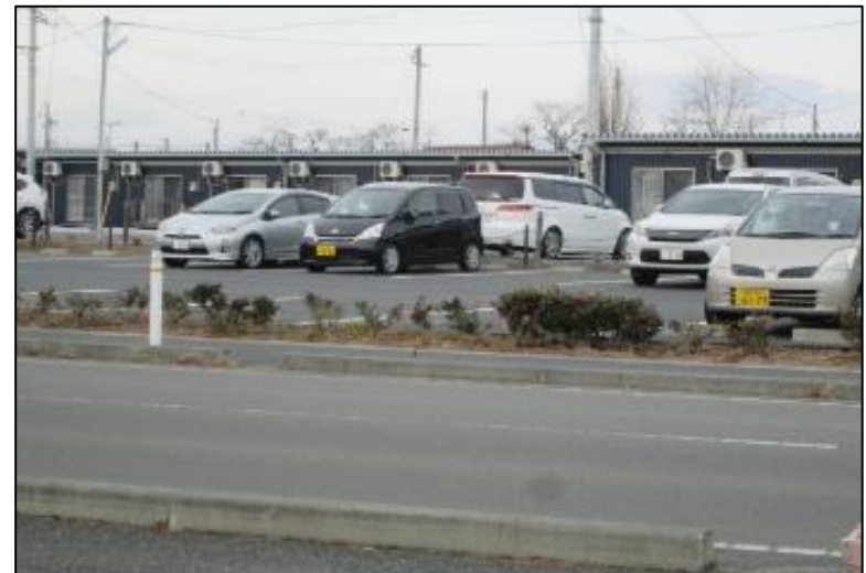
原町区桜井仮設住宅 未だに高齢者が多く住む