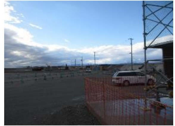
まだまだ防潮堤は繋がらない