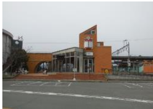
双葉町駅 あの日のまま