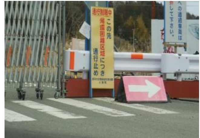
双葉町 ジャバラゲートでいまだ通行止め