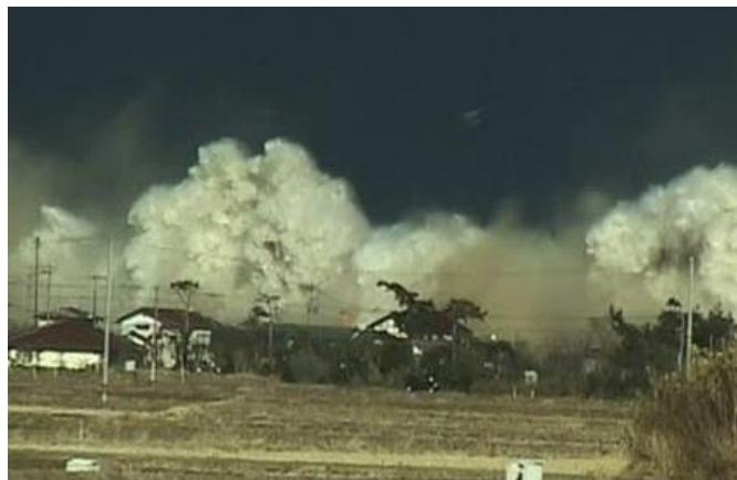
原町区小沢集落15mの津波到達

大地震 南相馬市震度6弱 大津波到達。津波による死者 636人 厳しい寒さと、停電、断水の不安な 夜を明かす