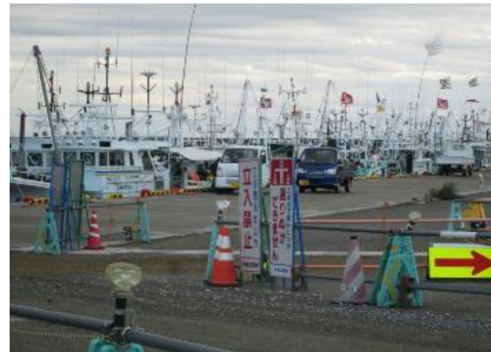
請戸漁港26隻漁船戻る

「浪江町復興は請戸地区から！」の思いは強い。しかし、関連施設建設はまだまだ。試験操業で水揚げされた魚類は、原町区真野漁港に運ぶ。津波跡地は、ほぼ整地された。復興はこれから～