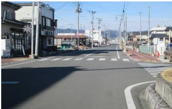
小高駅前 日中は通りを行き交う人もない