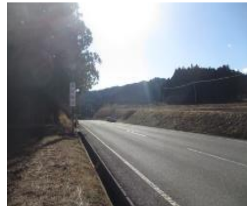
国道34号線浪江 避難解除で通行が可能になった