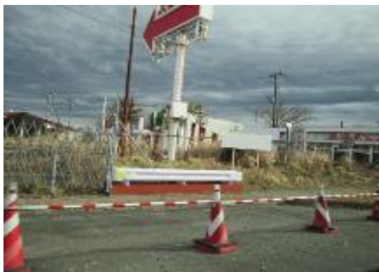
国道6号線大熊町 封鎖が続く