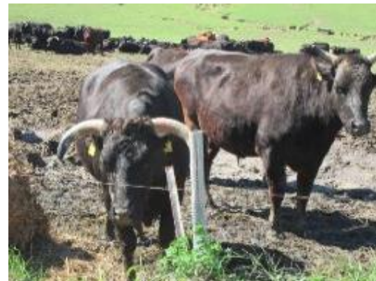
国道6号線沿い原町区太田地区 仮置き場 浪江町吉沢牧場 除染廃棄物の山 除染後の牧草地に暮らす牛