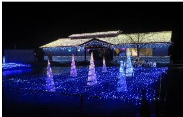
小高駅前広場 ライトアップ 住民の再会の場

戻る住民が少しずつ増え始めた。しかし、多くは高齢者である。生活環境が最優先である。