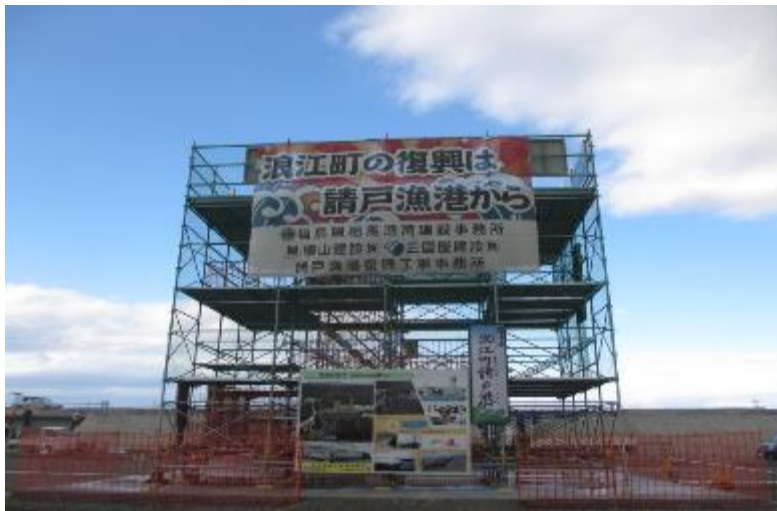
早期復興願って 横断幕・完成図