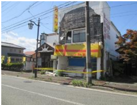
商店は当時のまま