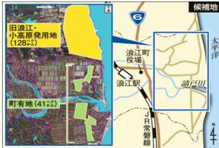
水素工場建設予定図