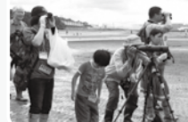
過去の観察ワークショップ