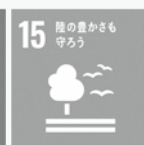
エスディーズ SDGs マークの例