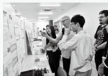
過去のパネル展示