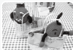
新聞紙で作るバッグ