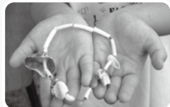
三番瀬の貝がらで工作体験