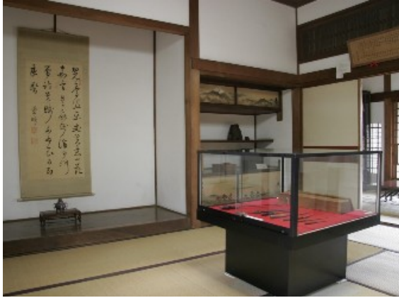
佐倉順天堂記念館展示